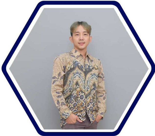
Direktur Utama Yoga Sastra